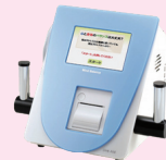
ストレス計 (マインドチェッカー or マインドバランス)