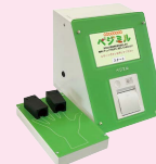
野菜摂取度測定器