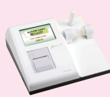
骨健康度計 (骨ウェーブ)